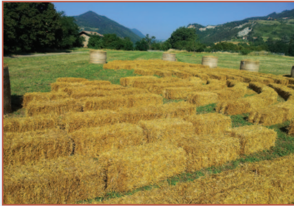
Museo Nazionale Etrusco "Pompeo Aria" via Porrettana Sud 13, Marzabotto (Bo)

In caso di maltempo gli spettacoli si terranno al Teatro Comunale, via Matteotti 1, Marzabotto